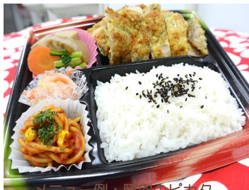
メニュー例：豚肉のピカタ

かわせみの家のお弁当は、 毎日“いちから手作り”です！ かわせみの畑でとれた野菜を たっぷり使い、真心をこめて 作っています！